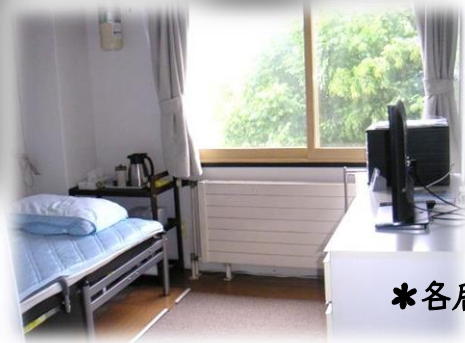
*各居室に押し入れがついています